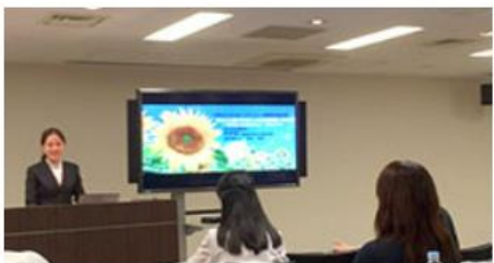
> 成人歯科保健活動（職域）