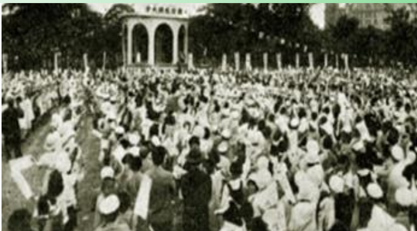
1932年第1回学童歯磨教練体育大会