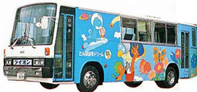
新口腔衛生車「たんぽぽ号 ドリーム」