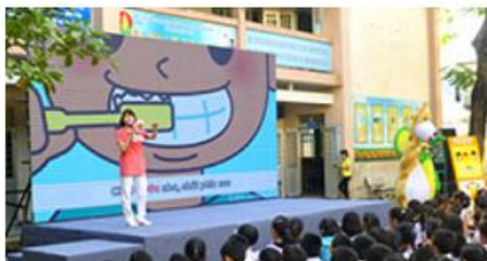
> 海外歯科保健活動