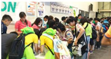
> 思春期歯科保健活動