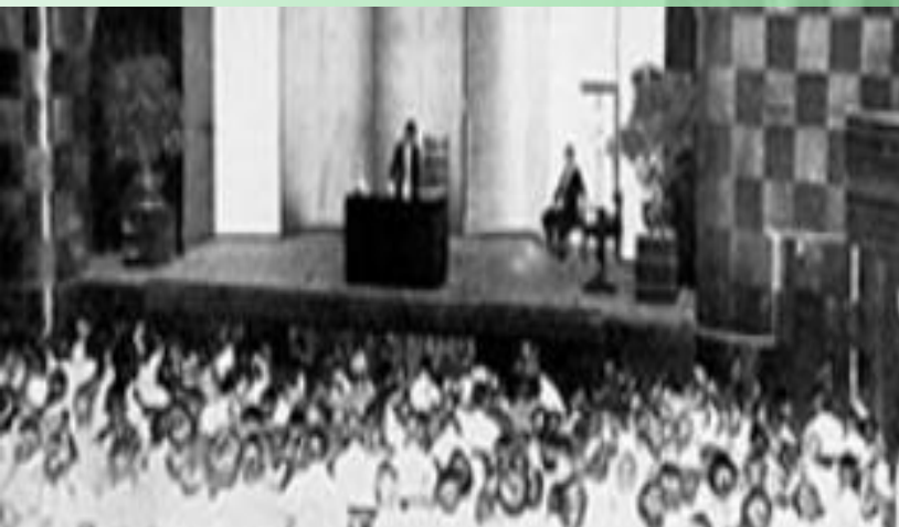
1913年 口腔衛生普及活動開始