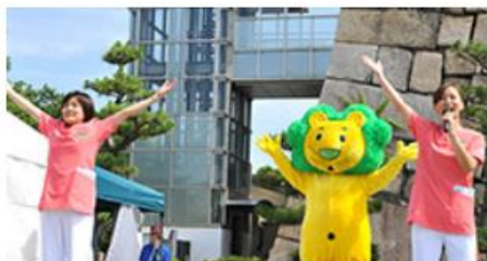
> 高齢者歯科保健活動