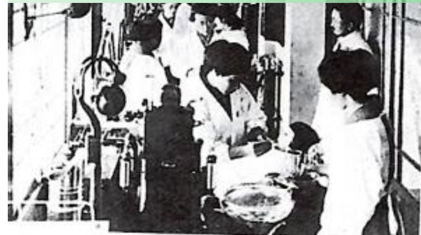
1922年 婦人口腔衛生手養成を開始