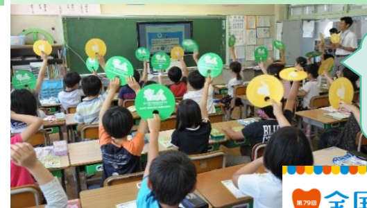
全国小学生歯みがき大会の発展