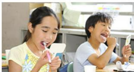
> 小学生歯科保健活動