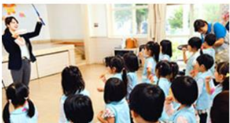
> 母子歯科保健活動