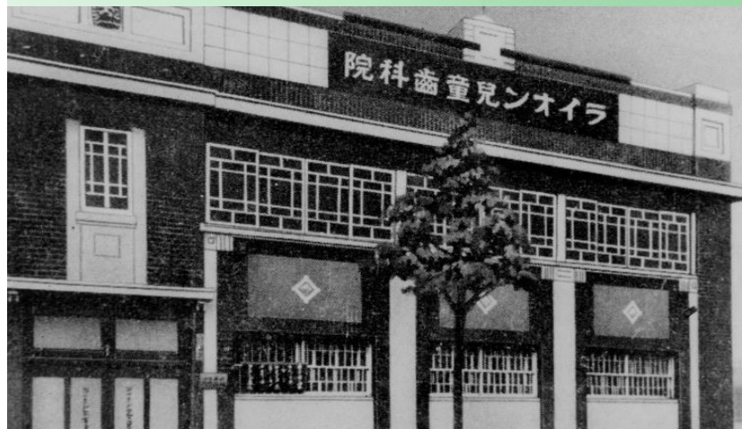
1921年 ライオン児童歯科医院開設